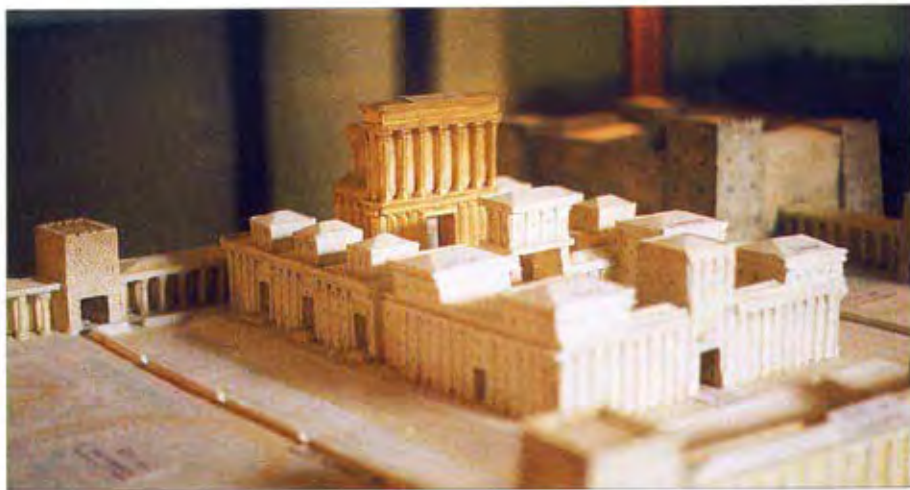
Maqueta del temple. Al fons la Torre Antònia.