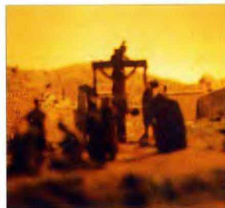
Sobre aquestes línies: Vistes de la Sala de Maquetes.