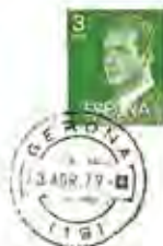
PATROCINADA PER LA JUNTA DE COFRADIES I ORGANITZADA PER LA SEAT. FILATELICA GERONINESA.

La següent Confraria va ser la del Silenci. La marca va utilitzar-se el 8 d'abril de 1977 i també representa l'escut de la Confraria.