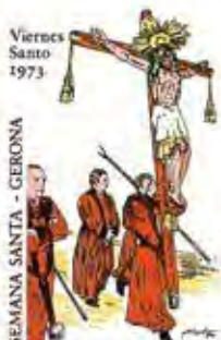
CRISTO Y PORTANOS DE LA REAL COFRADIA DE LA PASION Y MUERTE DE N. S. JESUCRISTO.