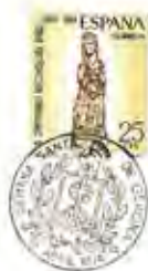
PATROCINADA PER EL RECTOR - CATEDRAL I ORGANITZADA PER LA SEAT. FILATELICA GERONINESA.