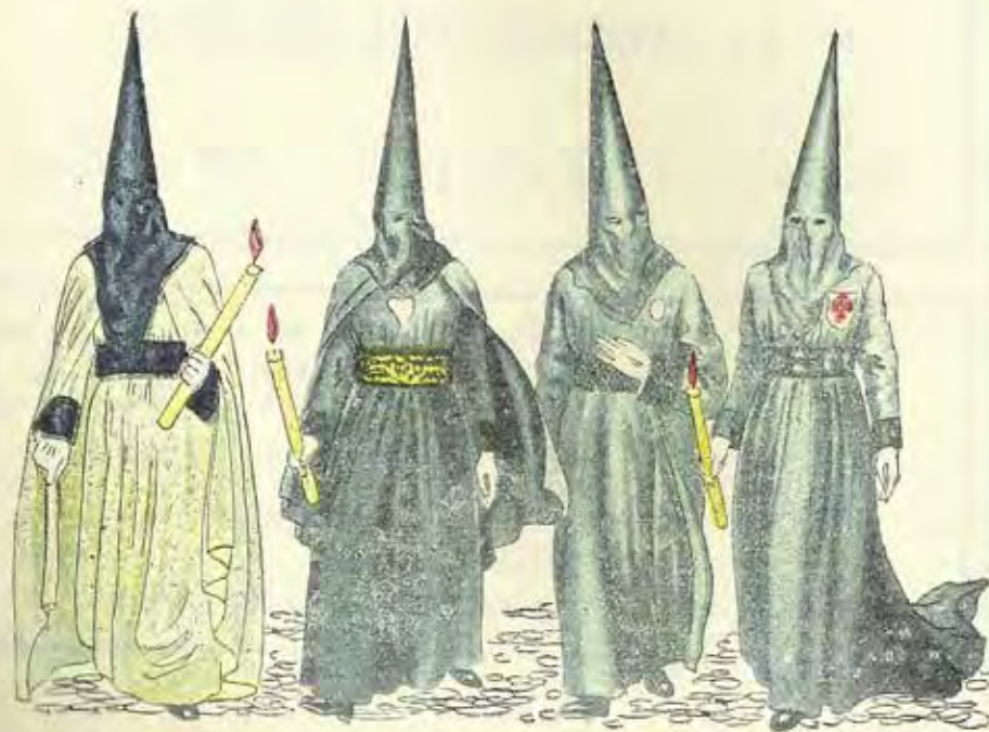
Cof. del Silencio