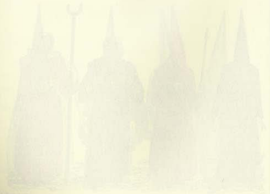
Faint text caption for the bottom illustration.