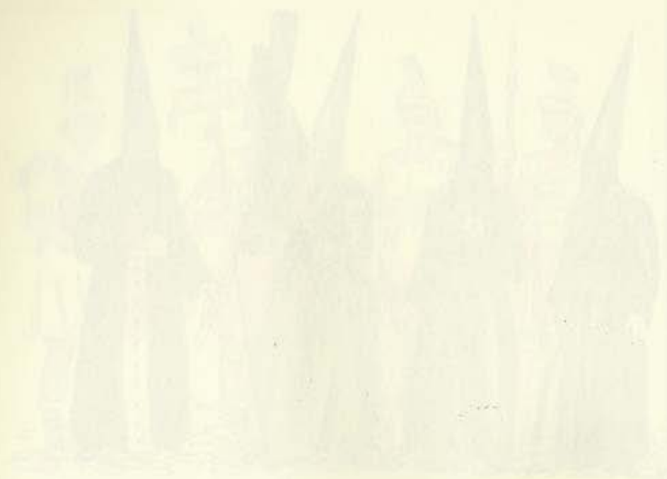
Faint text caption for the top illustration.