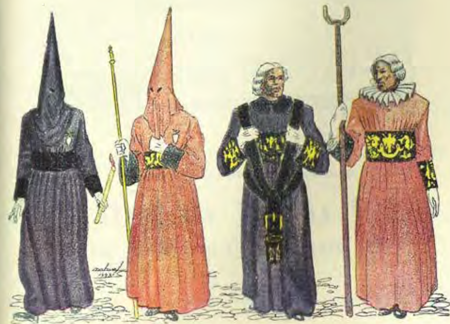
Cof. de la P. y Muerte