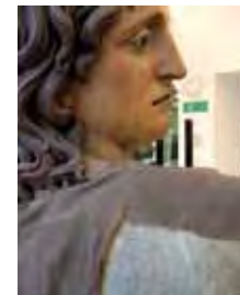
Detalls de la Magdalena i de Sant Joan durant el procés de neteja dels drapejats.