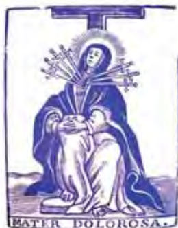
Grafisme utilitzat en l'antic manual del congregant de VCMDDB.

Un temps en el qual Maria esperaria en soledat, amb tristesa i desconsolada, una vegada el seu fill fou sepultat. Quin últim patiment, d'espasa travessant el seu cor, tot acaronant-lo i acomiadant-se terrenalment del seu fill, recordant tots els moments amargs viscuts durant la seva passió i mort. Moments de dolor, silenci i espera, però també de pregària i de record cap al fill difunt. En tot, Maria tenia l'esperança en la Resurrecció del fill de Déu que es va fer home per a salvar-nos. Altrament, Maria es devia trobar entre la trista pèrdua d'un fill i el fet de conviure amb aquells qui el van matar. Quina força Maria ens dóna en aquests moments, compassiva amb tot i amb tots, entre el dolor i l'esperança.