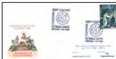
Sobres amb matal·segells oficials, concedits per la Direcció General de Correus i Telègrafs.