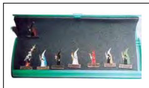
Estoig recopilatori de tots els Pins dels diferents confreres que s'han editat.