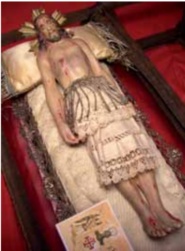
Sant Sepulcre del s.XIX que va pertànyer als meus besavis i que ara tinc l'honor de custodiar.

Girona, cada any celebra la Processó del Sant Enterrament el divendres Sant, i reviu el drama de la passió i mort de Crist. En aquesta, la Confraria del Sant Sepulcre, amb el Pas dels Perfums, la Guàrdia i el Pas del Sant Sepulcre, continua exaltant i representant aquesta escena amb total devoció i honor.