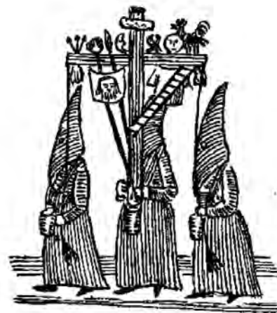
Arxiconfraria de la Passió i Mort de N.S.J.C.

Des d'aquí volem convidar tots els qui ho desitgin a acompanyar-nos el proper divendres sant, 29 de març. El punt de trobada és a la Basílica Parroquial de Sant Feliu de Girona, a les 9 del vespre, per anar tot seguit cap a la Catedral, per a participar a la processó del sant Enterrament.