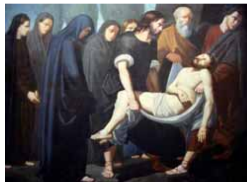
Quadre del Setè Dolor del s. XVIII, pertanyent a la VCMDDB.

És segurament en aquest Setè Dolor, on l'enllaç de la Venerable Congregació de la Mare de Déu dels Dolors de Besalú (VCMDDB - any 1699) amb el Sant Sepulcre de Palera es materialitza amb una forta unió. Palera representa des de fa molts segles un Dolor de la Mater Dolorosa . Aquesta vinculació porta a la ferma devoció al Sant Sepulcre, una devoció a Besalú que ha fet que molts fidels, al llarg de la història, hi hagin anat en romeria. Afortunats per la curta distància que ens separa de la Vila Comtal del vell Priorat, sempre ha sigut motiu de visita de famílies, escolars o fidels, tot fent camí a peu cap a Palera.