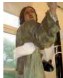
Detalls de la figura de Sant Joan durant el procés de neteja.