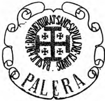
Antic segell de la Basílica del Sant Sepulcre de Palera.

A l'any 1085 (s. XI) fou consagrat el nou temple Basílica pel bisbe de Girona Berenguer Guifré, assistit per l'arquebisbe de Narbona i pels bisbes de Carcassona, Magalona, Barcelona, Elna i Albó, així com l'abat benedictí de Santa Maria de La Grassa (Llenguadoc-Rosselló). Un dels patrocinis més destacats de la nova Basílica fou per part del senyor de Palera, Arnald Gofred i la seva muller Brunegilda, que foren el nexa d'unió de la nova fundació del Priorat. Ens preguntem des de fa temps, si l'origen del Priorat fou al Castell de Palera, l'anomenat La Masó , a tocar de l'església de Santa Maria, però aquí queda el dubte de l'origen. L'altre dubte és el perquè de les advocacions de Sant Salvador i de Sant Domènec i les circumstàncies que van portar a la decisió de construir la nova Basílica. En el testament del Comte de Besalú i Bisbe de Girona, Miró II, l'any 977 (s. X) hi podem trobar ressenyes molt inicials, així també, com en un altre document del 1075 (s. XI), podem veure citats ja límits de noves terres del nou temple Basílica.