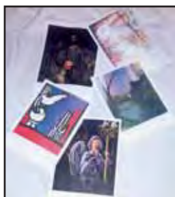
Litografies signades pels diferents autors dels Cartells de Setmana Santa.