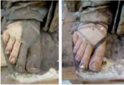
Detalls de la figura de Sant Joan durant el procés de neteja.