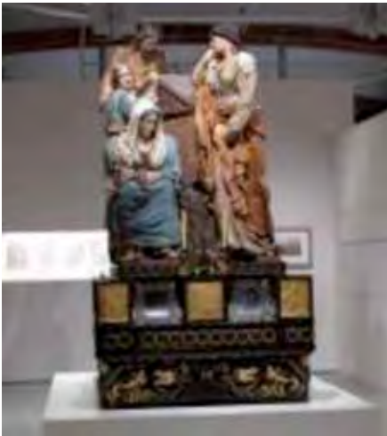
El pas del "Sant enterrament" en l'exposició "El museu explora" del MNAC (gener 2013)

de Prússia; el vestit de Nicodem de color vermell està realitzat amb una barreja de blanc de plom i de vermells (laca vermella, vermelló i mini). 2