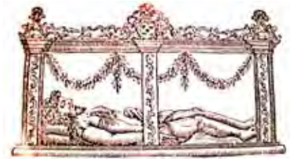
Grafisme il·lustrat al quadre de l'acta de consagració, de la Basílica del Sant Sepulcre de Palera.

La necessitat de representar, durant els dies Sants, la sepultura de Jesús en els dies d'impàs entre la passió i mort i el Diumenge de Resurrecció, el Crist Jacent dins d'una urna protectora començava a introduir-se en les representacions religioses cristianes, ja podia ser el Crist tot sol o amb grup escultòric, representant al voltant d'aquest els personatges evangèlics de la sepultura de Jesús, com Josep d'Arimatea, Nicodem, Maria Salomé, Maria de Cleofàs, Maria Magdalena, la Verge Maria i Joan l'Evangelista, entre d'altres dones i homes que acompanyaven el cos mort de Crist cap a l'interior del Sepulcre. Una representació seguint el ritual funerari de l'època, de neteja del cos i perfumat amb aromes tot envoltat amb un llençol. És en aquest moment, amb la pèrdua del Messies i Fill de Déu, que tot semblava acabat però, Maria, amb el seu gran cor de Mare i la seva Fe en Jesucrist, no podia oblidar la promesa del seu Fill « al tercer dia ressuscitaré » (Mateu 27, 63).