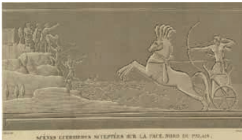
SCÈNE D'ÉQUIPE EN ÉQUIPE SUR LA FACE NORD DU PALAIS

L'any 1799, Napoleó Bonaparte comença l'anomenada campanya d'Egipte. L'objectiu polític de l'expedició se situa en el context de la rivalitat entre Gran Bretanya i França per a dominar el món. El cos expedicionari anava acompanyat d'un gran equip de científics —historiadors, botànics, dissenyadors—, que realitzaren un treball imponent que es publicà entre els anys 1809-1829. El títol de la monumental col·lecció, que en la primera edició constava de 23 volums era: Description de l'Égypte ou Recueil des observations et des recherches qui ont été faites en Égypte pendant l'expédition de l'armée française, publié par les ordres de sa majesté l'empereur Napoléon le Grand . Aquesta obra ha tingut una influència cultural incalculable, ja que donà origen al naixement de l'egiptologia com a ciència.