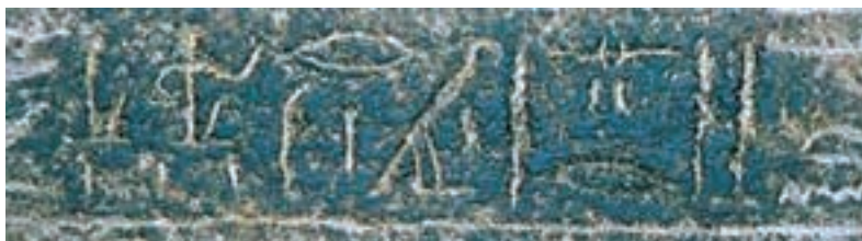
( https://en.wikipedia.org/wiki/Merneptah_Stele )