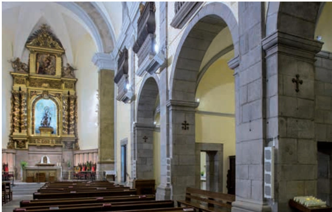
Creus del Via Crucis a l'església del Carme de Girona.

Els participants del “Via Crucis” –expressió llatina que significa “Camí de la Creu”– evoquen els moments més importants de la passió. Es tracta del recorregut que va fer Jesús carregat amb la creu des del pretori de Pilat fins a la muntanya del Calvari. Pietoses tradicions han volgut remuntar el seu origen als primer anys del cristianisme, assegurant que la pròpia mare de Jesús hauria marcat els llocs de la via dolorosa visitant-los assíduament.