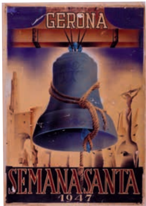
(2) Del programa de la Junta de Confraries de l'any 1950.